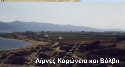
Λίμνες Κορώνεια και Βόλβη